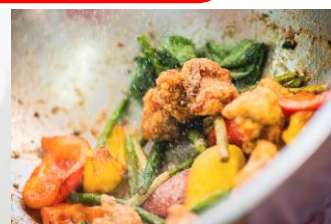
△塩酥鷄（イエンズージー）