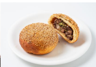
△胡椒餅（フージャオピン）