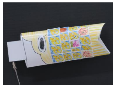
△使用済み切手を使ったこいのぼり (イメージ)

期 間 2023年4月15日（土）～5月7日（日）の土日祝日 ※日によってワークショップの内容が異なります。 詳しくは郵政博物館HPをご覧ください。 ( https://www.postalmuseum.jp/ ) 時 間 14:00～17:00 (絵手紙のみ14:00～15:30) 場 所 東京スカイツリータウン® イーストヤード9階 郵政博物館 多目的スペース 料 金 無料（入館料は別途かかります）