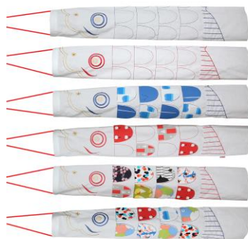
△「マイこいのぼり」(イメージ)