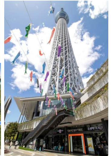
△ソラマチひろば（過去の様子）