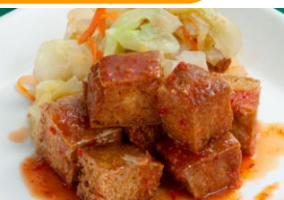
△炸臭豆腐（ザーチョウドウフ）