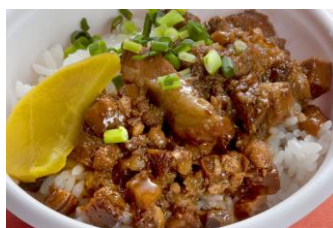
△魯肉飯（ルーローファン）