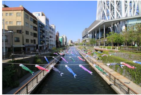
△北十間川（過去の様子）