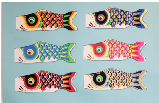
△手書きこいのぼり作品例