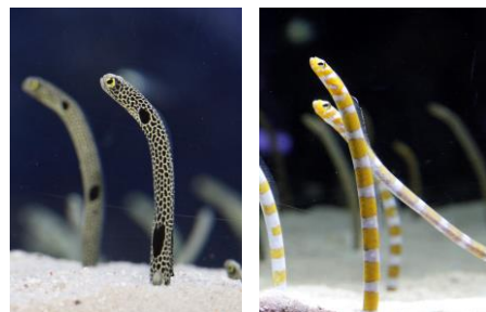
△チンアナゴとニシキアナゴ