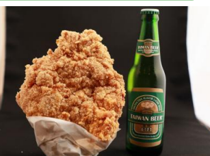
△大鶏排（ダージーバイ）