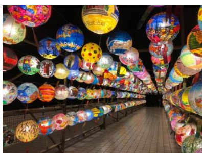
△「普濟殿ランタン祭り」のランタン（イメージ）