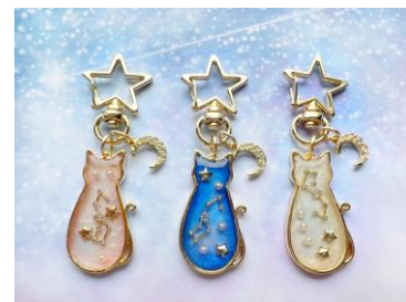
△星空ネコキーホルダー(イメージ)