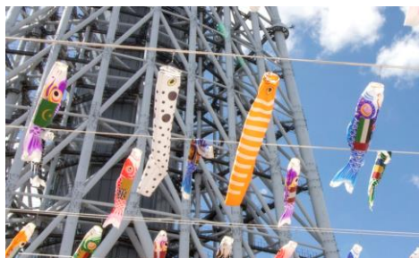
△チンアナゴのぼり、ニシキアナゴのぼり（昨年の様子）

掲出期間 2023年4月14日（金）～5月7日（日） 場 所 東京スカイツリータウン4階 スカイアリーナ