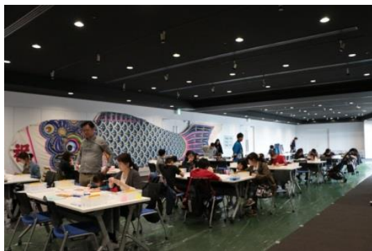
△こいのぼりワークショップ(過去の様子)

期 間 2023年4月29日（土・祝）、30日（日） 場 所 東京ソラマチ® イーストヤード5階 スペース634 料 金 500円（予定）