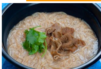
△台湾麵線（ミエンシェン）