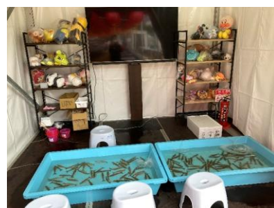
△エビ釣り（イメージ）