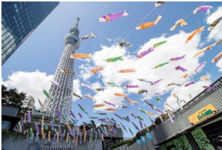
△ソラミ坂（過去の様子）

期 間 2023年4月14日（金）～5月7日（日） ※一部のこいのぼりは掲揚期間が異なります。 場 所 東京スカイツリータウン各所 ※荒天時は予告なく掲揚を取りやめる場合があります。